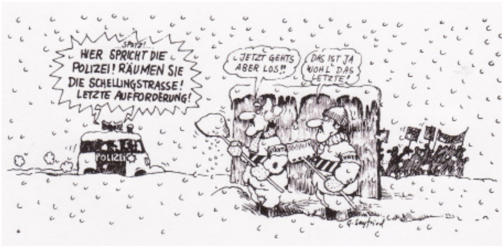
Neulich im Winter in Stuttgart – oder in Bottrop oder in Berlin oder in Tunesien oder in Ägypten – aber da liegt ja kein Schnee