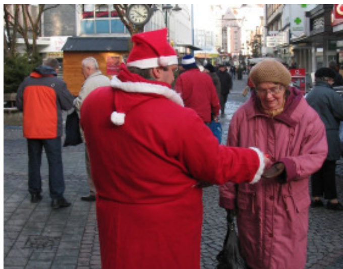
Der DKP-Nikolaus verteilte auch 2010 wieder Geschenke

Mitglieder der DKP-Ratsfraktion im Gespräch mit Anwohnern der Bahnlinie im Vonderort. Während sich die Bahn nach langen Verhandlungen und Protesten an der Vonderbergstraße zu – wenn auch halbherzigen – Lärmschutzmaßnahmen bequeme donnern die Bahnen an den Straßen Im Brahmkamp, Lüderitz- und Wissmannstraße nicht nur weiter, sondern es wurden auch die wenigen Bäume abgeholzt, die wenigstens etwas Lärmschutz boten. Das brachte das Fass zum Überlaufen: Eine Nachbarschaftsinitiative wurde gegründet. Die Bahn sagt momentan jedoch nur Lärmschutz an den Fenstern der Anwohner zu. Das reicht jedoch bei Weitem nicht.