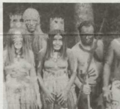
Ferienlager Ückeritz 1974: Neptun-Taufe

„UZ-NOTIZEN“ hat zwei alte Fotos von „damals“ rausgekramt: wer sich wiedererkennt, soll sich bitte melden: am Kinderferien-Treff auf dem Volksfest am 11./12. August. Preise winken!