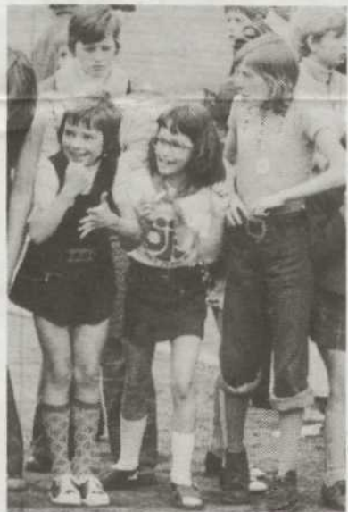
3 Kinder von damals - was machen sie 10 Jahre später? Bitte melden!

Tage später fuhren 800 Kinder mit der DKP-Ratsfraktion und den „Jungen Pionieren“ zum ersten Mal in die DDR, z.B. nach Ückeritz.